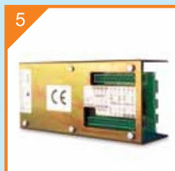
5 Революционно ел.табло

32 бита микропроцесор и инверторна технология с отделни настройки за волтаж и честота (VVVF)