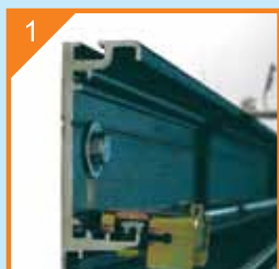
1 Масивни релсови профили до 5 мм дебелина