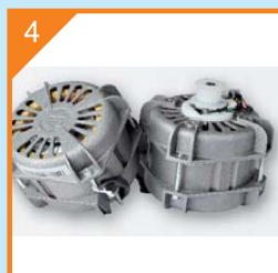
4 Устойчиви трифазни АС безчеткови електромотори

Изолиран с амортизираща каучукова подложка, лесен за подмяна, осигурява плавен и тих режим на работа