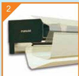
2 Закачен на пластичен профил капак

Предният капак е с каучуков елемент с бърз достъп до задвижващия механизъм за по-лесна поддръжка